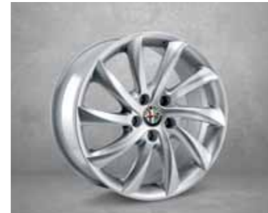
420 225/45 17" Türbin Hafif Alaşım Jantlar