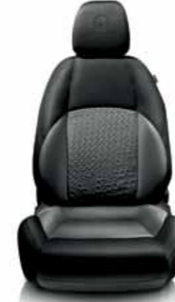
298 Siyah-Gri Kumaş Koltuk