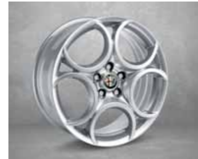
439 225/40 18" Süper Sportif Hafif Alaşım Jantlar