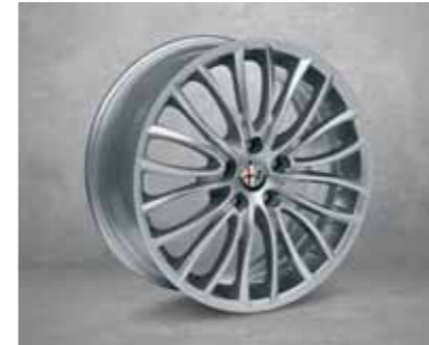
4AY 225/40 18" Hafif Alaşım Jantlar

Bu broşürde görünen renk tonları araç üzerinde farklılık gösterebilir.