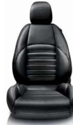
408 Siyah Deri Koltuk