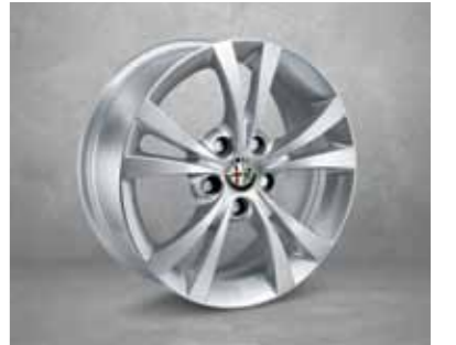
432 205/55 16" Çift Kollu Hafif Alaşım Jantlar