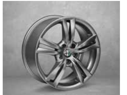
421 225/45 17" Çift Kollu Koyu Renk Hafif Alaşım Jantlar