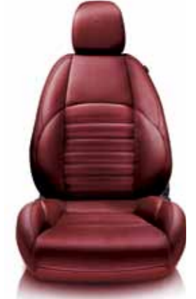
401 Kırmızı Deri Koltuk