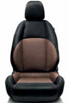
685 Siyah-Kahve Kumaş Koltuk