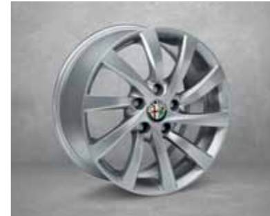
431 205/55 16" Türbin Hafif Alaşım Jantlar