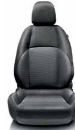
168 Antrasit Gri Kumaş Koltuk