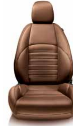
465 Taba Deri Koltuk