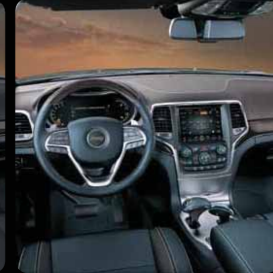
MAVİ GRİ/KAHVE DERİ