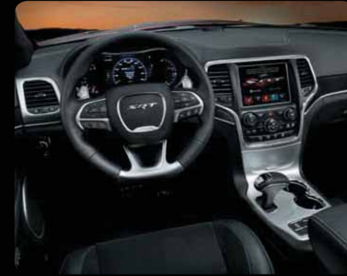
SİYAH SÜET DERİ