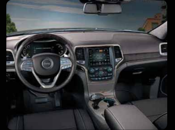
KOYU KAHVE DERİ