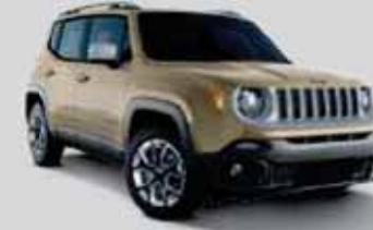
Mojave Kum Rengi